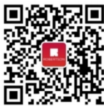
罗伯森·中国区招生客服二维码