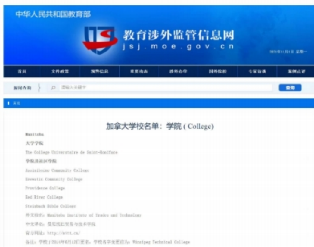
ACC学院在中国教育部认可在册名单